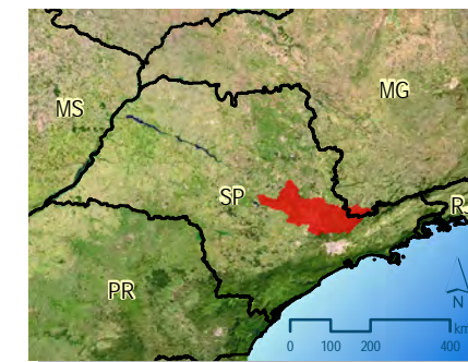
Localização da Bacia do PCJ